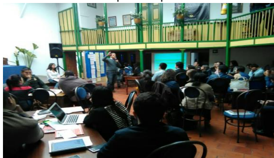
Descripción: Encuentro de capacitación con los municipios

Por otra parte, el contratista acompañó al equipo humano de la Oficina de Atención a Víctimas de la Secretaría de Gobierno, en la formulación del Plan de Acción Territorial de Atención a Víctimas del departamento de Caldas para el periodo 2016-2019.