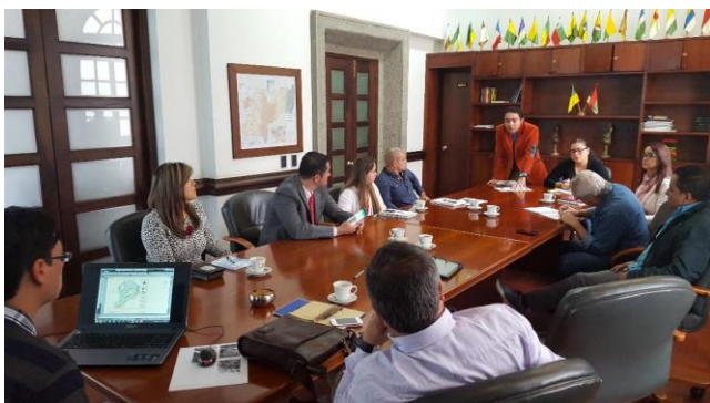
Descripción: Conformación de la Comisión Accidental

El Secretario de Integración y Desarrollo Social, como Secretario Técnico de la Mesa El Congal, dirigió el encuentro y definió los compromisos a los representantes de las instituciones presentes en el encuentro que históricamente han hecho parte del proceso de retorno.