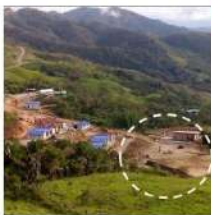
El Congal/Corregimiento de San Diego.